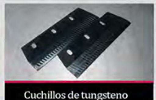
Cuchillos de tungsteno