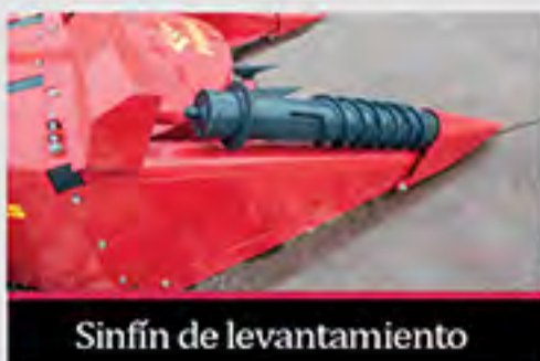
Sinfin de levantamiento