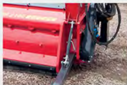
Altura de corte ajustable