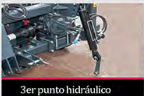
3er punto hidráulico