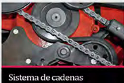
Sistema de cadenas