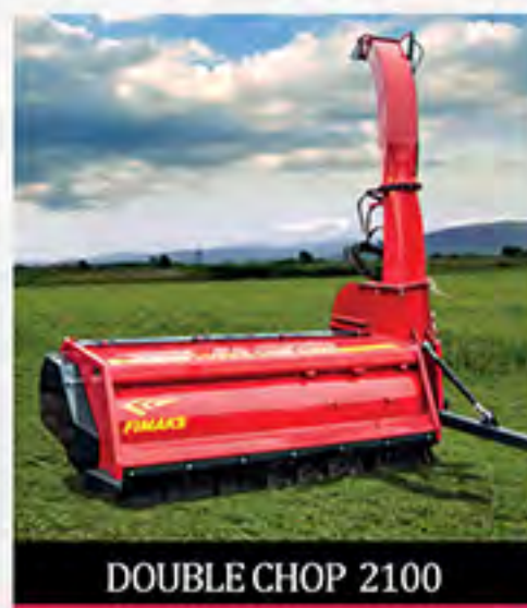
DOUBLE CHOP 2100