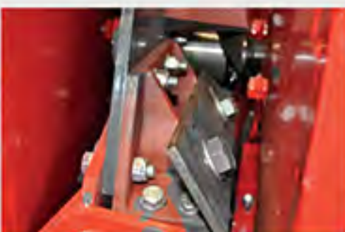
Sistema de repicado