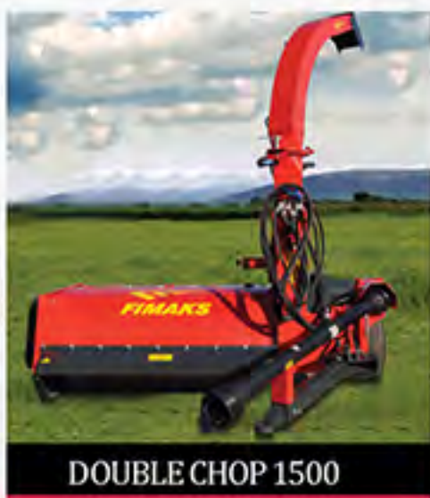
DOUBLE CHOP 1500