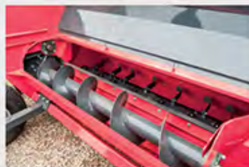
Sinfin de alimentación