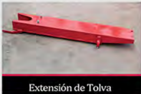
Extensión de Tolva