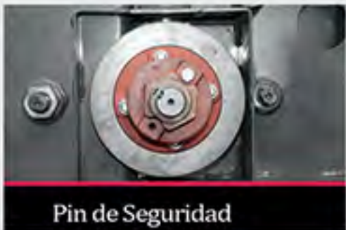
Pin de Seguridad