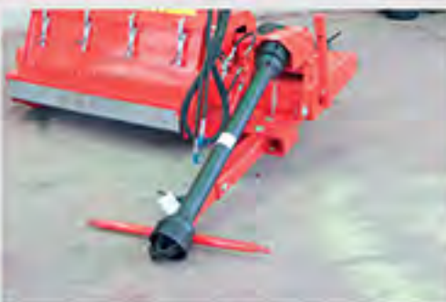
Modelos de tiro y de 3r punto